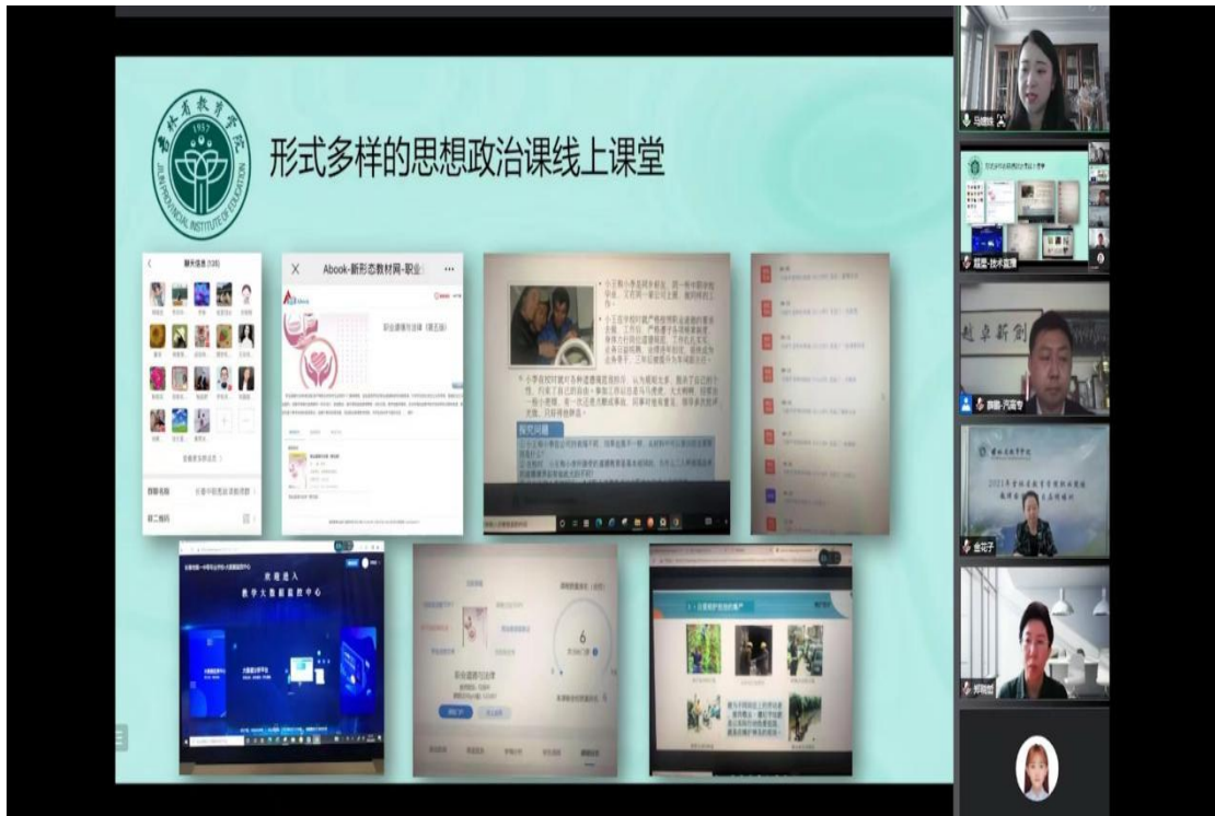
图十五：同上一堂思政大课

举办党的二十大精神进课堂暨吉林市大中小学思政课一体化建设集体备课活动。组织全体教师以教研组为单位按要求开展了一次集体备课，组内教师积极讨论，将思政教育有效地融入到各类课程教学中，落实立德树人的根本使命。