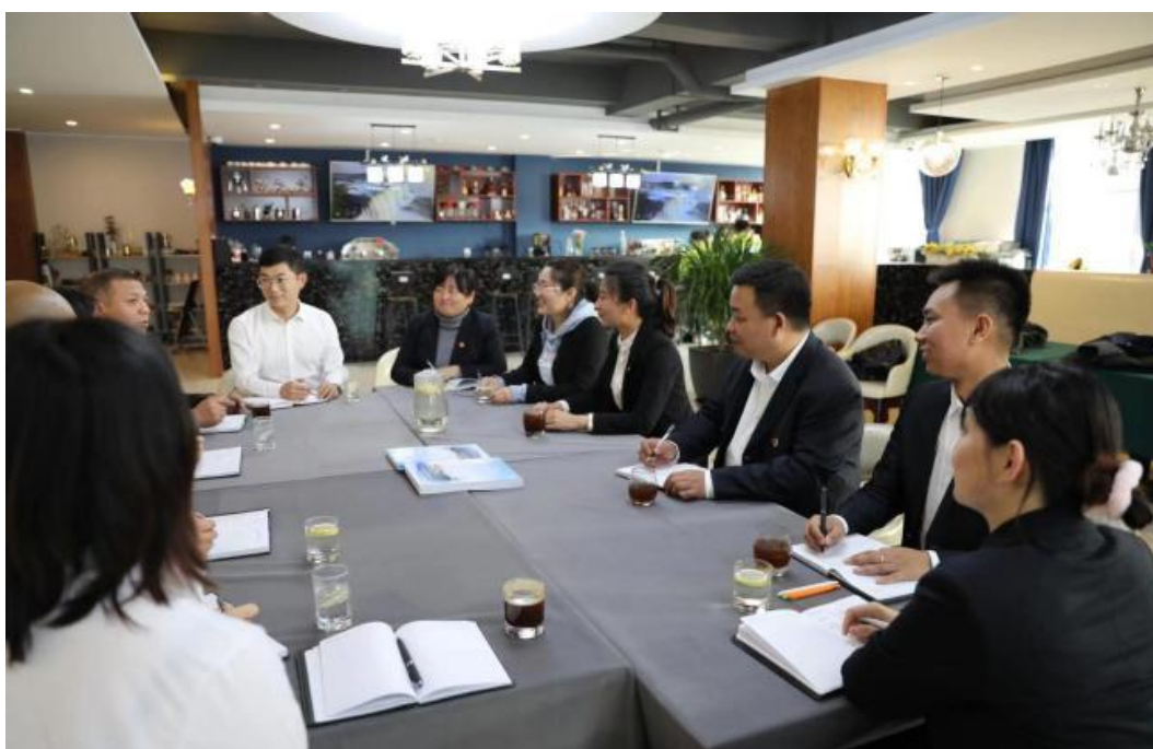
图七：青蓝工程师徒交流心得