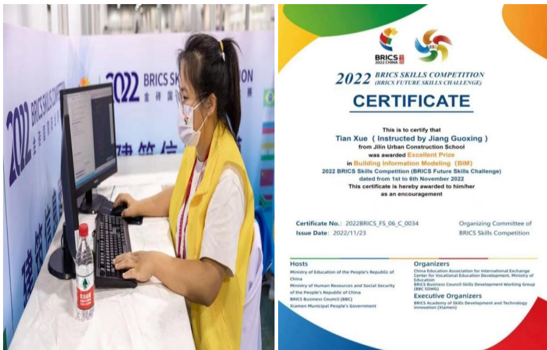
图十八：金砖国家职业技能大赛参赛教师及获奖证书