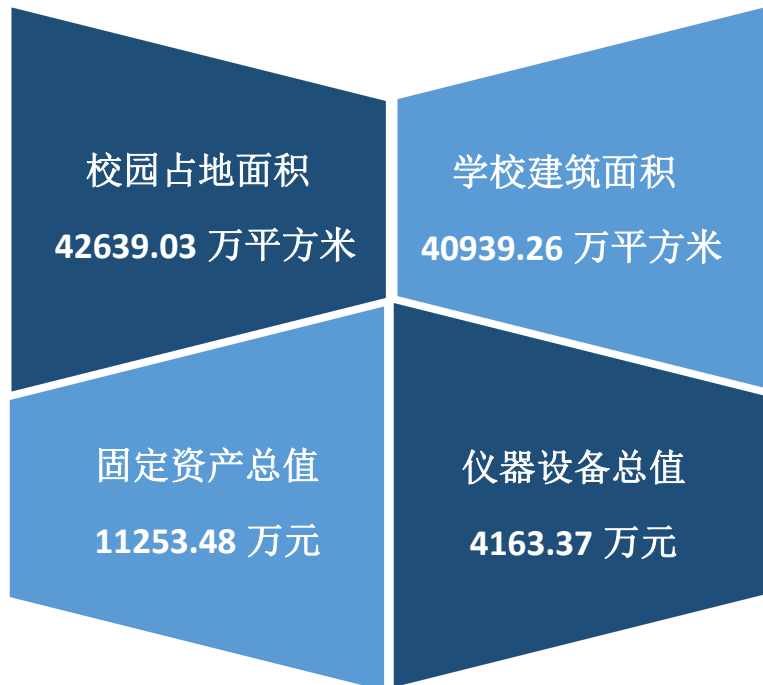
图一： 学校基本情况

学校采用理实一体的教学方式，开展实景体验教学模式，注重培养工匠精神，学生连年参加全国技能大赛成绩突出，是荣获全省首个国赛金牌三连冠学校。教学管理规范严格，对口升学本科率高。学校获批1+X证书制度试点项目。学校积极探索产教融合办学模式，发挥饭店餐饮烹饪协会会长单位的优势，正在规划吉菜体验馆深入开展产教融合型实训基地建设。