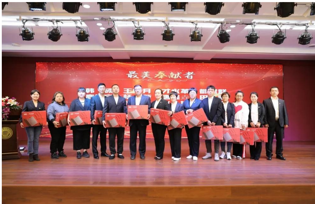
图五：吉林省城市建设学校第二期党员驻班先锋岗活动总结

学校制定了《吉林省城市建设学校关于开展“新担当、新突破、新作为”解放思想大讨论活动实施方案》，以开展“大学习、大排查、大调研、大落实”活动为载体，着力破解制约学校高质量发展的突出矛盾和问题。学校从党委会、支部书记会和支部会三方面进行了工作部署，组织填写调查问卷，开展深入调研，营造了解放思想、锐意进取、破解矛盾、攻坚克难、转变作风、争创一流的浓厚氛围。