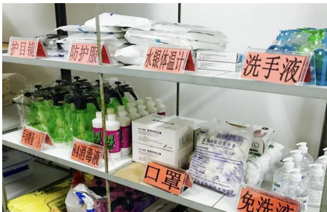
图二十四：学校部分疫情防控物资

不断强化后勤内部管理，本着“后勤工作必须服务于教育教学工作”的原则，在疫情防控、安全检查、校园校舍维修及建设、改善环境卫生等方面投入大量人力和精力，努力做好各项工作。并不断总结经验，促进管理水平和水平的提高，促进工作再上新台阶。