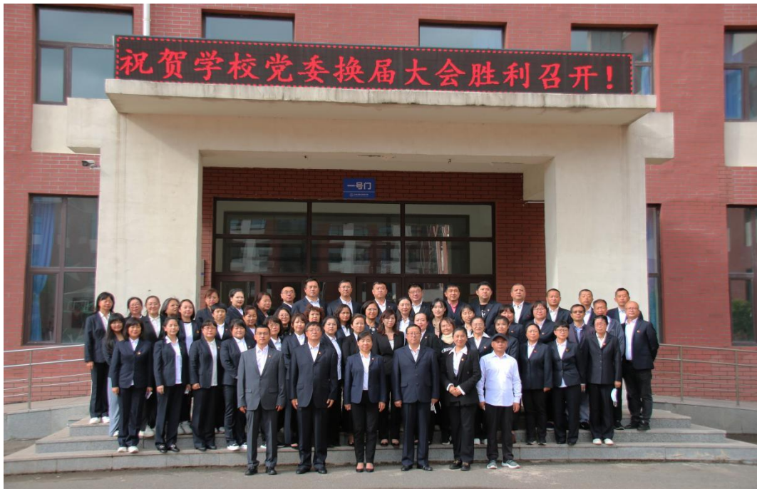
图三：吉林省城市建设学校换届选举党员大会

按照“控制总量，优化结构，提高质量，发挥作用”的总要求，严把发展党员政治关，4名党员如期转正，2名发展对象被接收为预备党员。