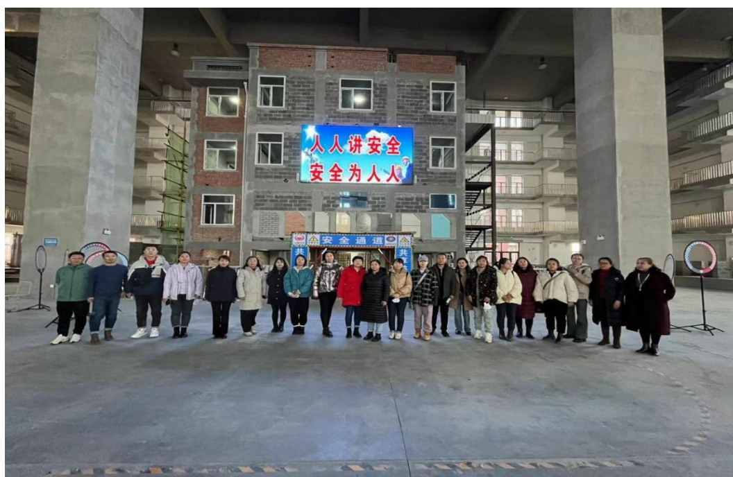
图十四：“实景体验式”教学模式改革

为了推进“实景体验式”教学模式改革，结合学校“双高”建设工作，智慧建筑专业群建设了智能建造实景体验中心；餐旅服务专业群建设了吉菜文化陈列馆。