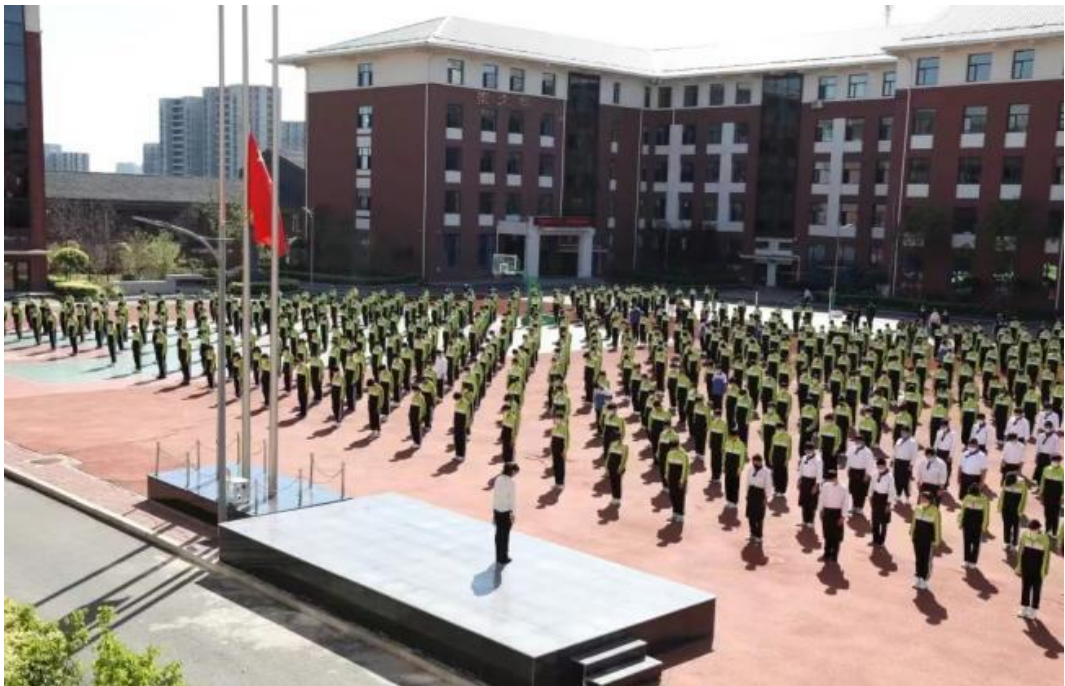
图九：学生日常教育大会

二是思想教育抓得透。学校始终坚持“五育”并举，以社会主义核心价值观为主线，开展“主题化、生活化、仪式化”的主题活动。开展升旗仪式教育活动，对学生进行了爱国主义教育。开展德育早课活动，完成了《中华经典诵读》校本教材的开发和使用，每天早课诵读国学经典，让学生们在潜移默化中提升境界、启迪智慧。开展主题教育月活动，如三月学雷锋活动、四月清明祭扫活动、五月感恩教育活动、九月尊师重教活动、十月革命传统教育、十一月安全教育等。通过丰富多彩的系列教育活动，使学生的情感、意志、品德、性格在实践与体验中得到了升华，做到知行合一，养成良好习惯。开展职业认知教育，带领学生走入企业进行参观，聘请优秀毕业生代表作为学校创业导师，组织6名优秀毕业生线上与学生进行了深入交流，取得了良好效果。通