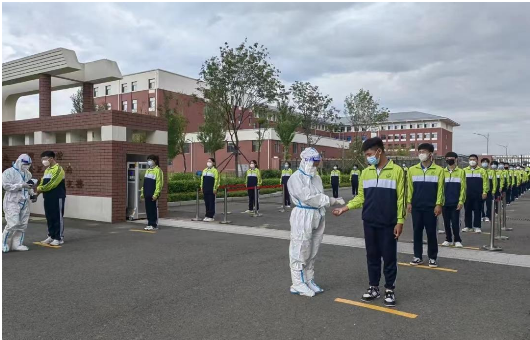
图二十七：学校工作人员为学生进行日常测温