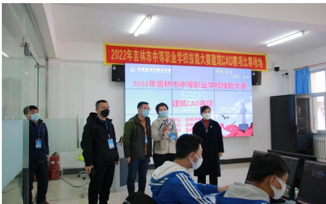
图十二：市中等职业学校技能大赛比赛现场