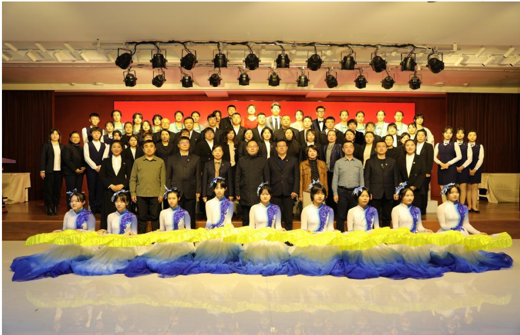
图八：班主任节庆祝大会

四是发挥活动的感化作用。学校成功举办了第二届“班主任”节，班级自发为班主任策划温馨而感人的庆祝活动，“班主任节”系列活动，如专题升旗仪式、茶话会、团建等活动，让班主任在平凡的工作中收获职业幸福感。