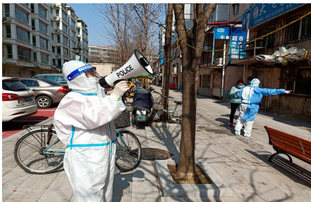
图四：教师下沉社区开展疫情防控工作

立抗疫信心，传播乐观向上的城建态度。学校先后在学校公众号中发表了抗疫先进事迹 20 余篇，其中有 8 篇在吉林市教育公众号上发表，宣传先进事迹的同时极大的激发了教师下沉参与志愿服务的积极性。