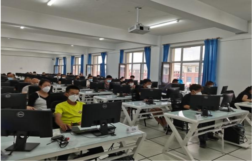
图十九：建筑安全三类人员培训考试