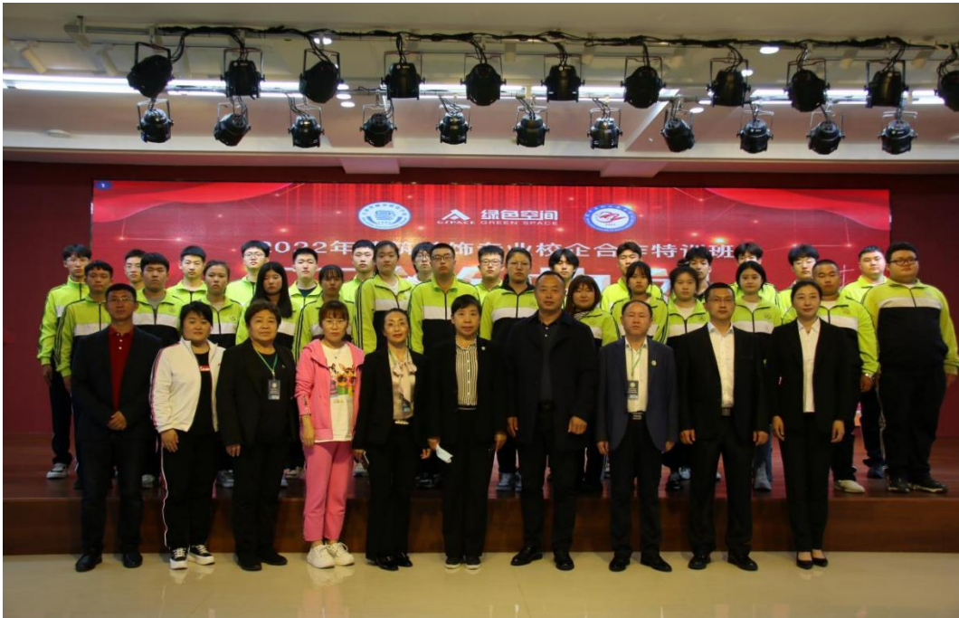
图十七：学校与吉林市绿色空间装潢设计所开展校企合作