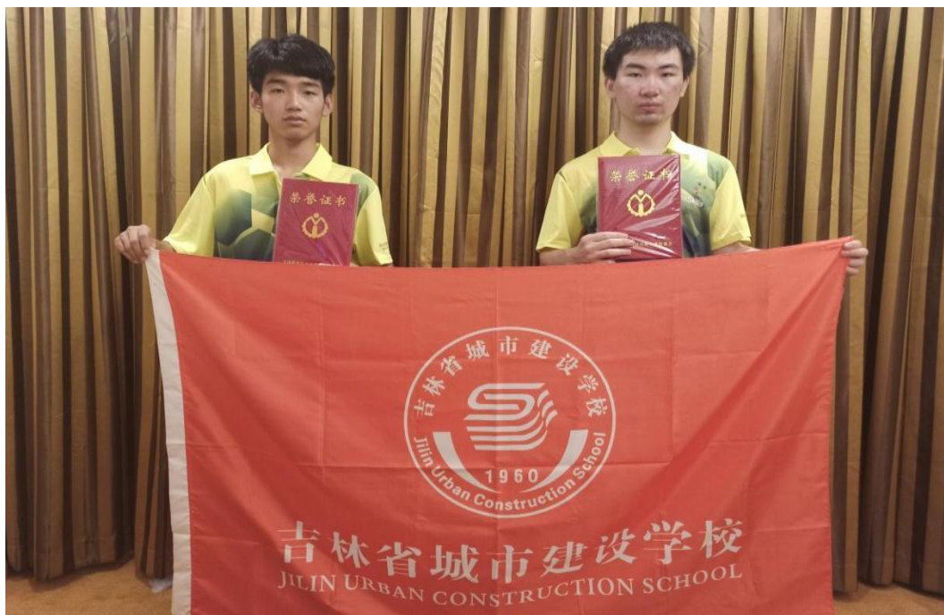
图十一：建筑 CAD 赛项国赛三等奖

学校严格执行疫情防控政策，组织 27 名学生参加了 8 项省赛、55 名学生参加了 11 项市赛，成绩名列前茅。