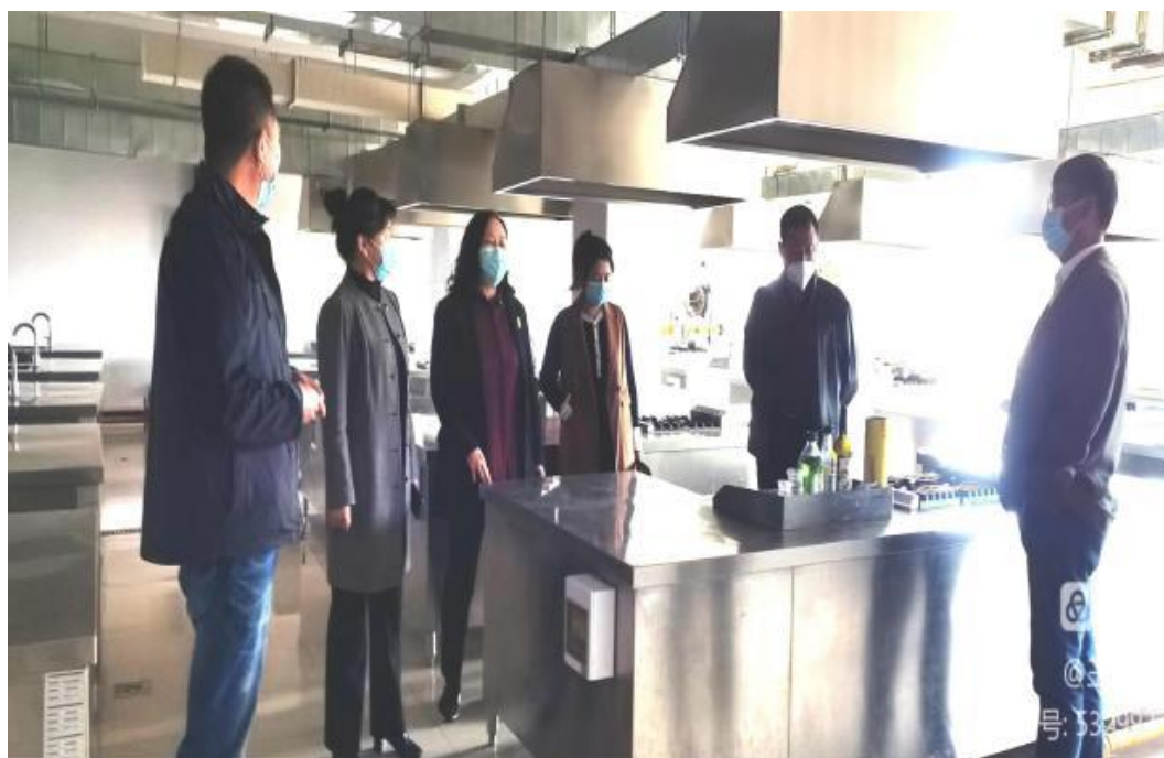
图二十五：排查学校安全隐患

二是建立排查台账。在日常安全检查和隐患排查中，及时记录发现的安全隐患并上报总务部门维修维护，建立隐患台账，限定整改期限，做好巡视检查记录。