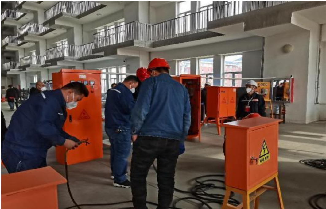
图二十一：建筑电工实操培训