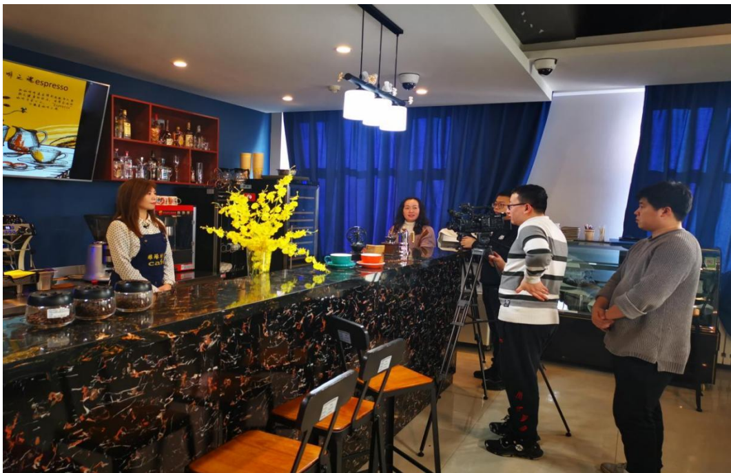
图十六：在线精品课程录制

线上精品课程。在吉林省 2022 年职业教育在线精品课程遴选和国家在线精品课程推荐工作中,《主体结构工程施工》被确定为省级在线精品课立项建设课程。