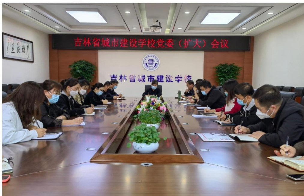
图二：吉林省城市建设学校党委（扩大）会议

道作用，认真开展思政课教学，校党委书记与思政课教师进行深入的座谈交流。面向全校师生开展思想政治教育，强化各学科各专业教学中渗透思想政治教育，全面抓好师生思想政治工作，组织全体教师开展了 2 次课程思政培训。