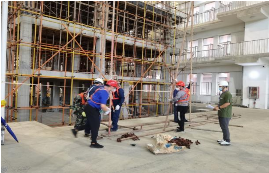
图二十：建筑架子工实操培训