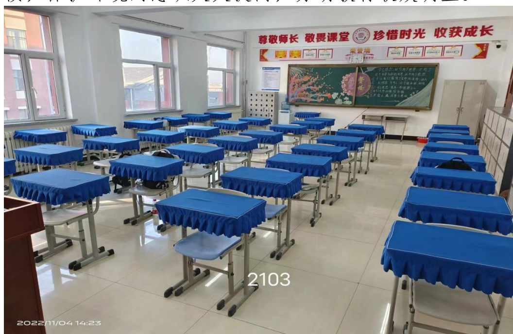
图十：班级卫生日常评比

三是劳动教育做得巧。 从秋季学期开始，在学生公寓从生活卫生习惯养成入手开展劳动教育，公寓楼内取消公共区域垃圾桶，学生自备垃圾袋收集清理个人生活垃圾，在规定时间内统一倒入指定垃圾桶。短短两个月成效显著，培养学生养成良好的卫生习惯，保护环境的意识大大提高，劳动教育收效明显。