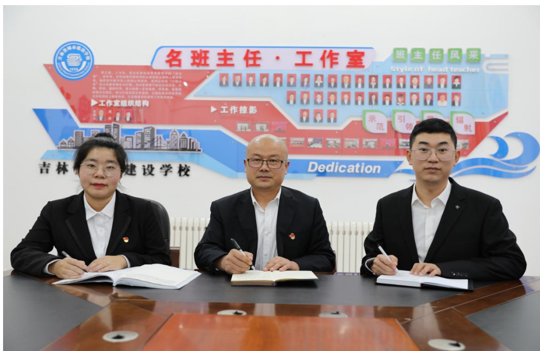
图六：名班主任工作室